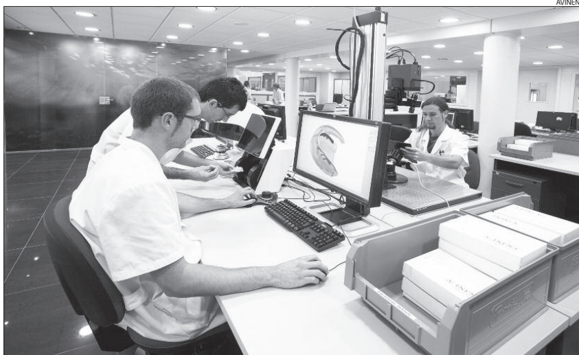
Vista de les instal·lacions d'Avinent a Santpedor

La relació d'Avinent amb Core 3D es va gestar gràcies a la investigació en el fresat d'estructures dentals personalitzades de titani i crom-cobalt feta per Protec, la divisió de tecnologia Cad-Cam d'A-